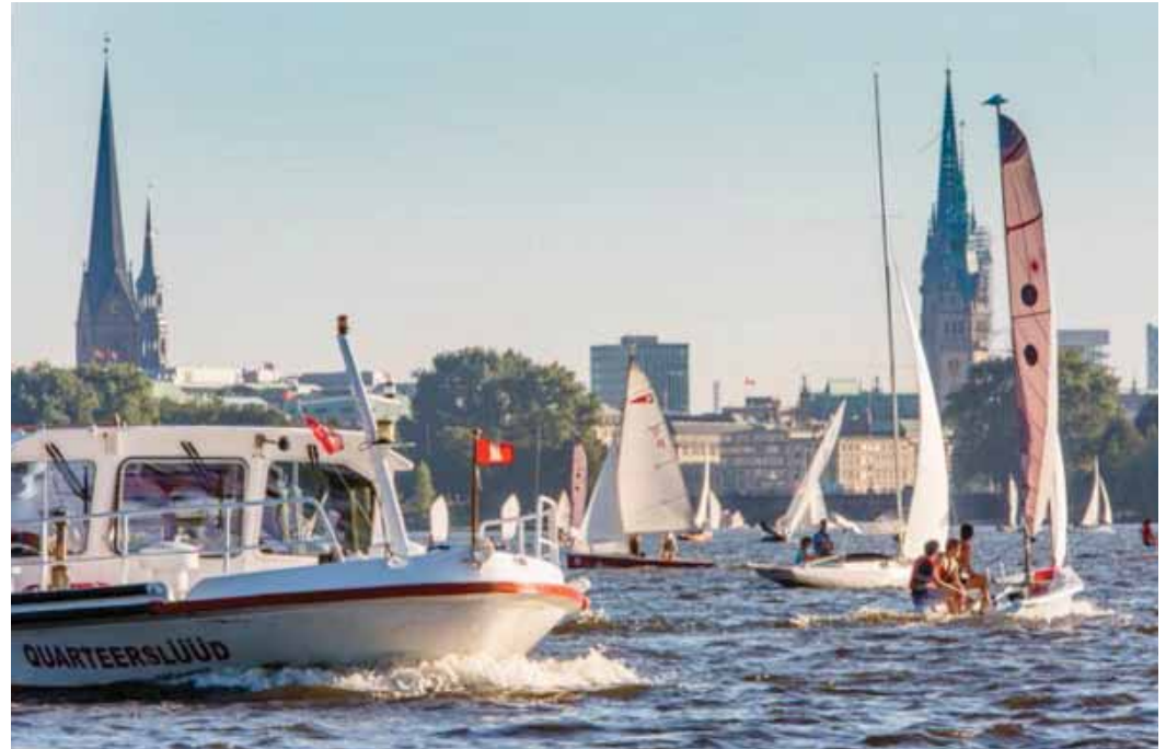
Regata en el Binnenalster

Freie und Hansestadt Hamburg: „Das Tor zur Welt“. Ciudad Libre y Hanseática de Hamburgo: “La puerta que se abre al mundo.”