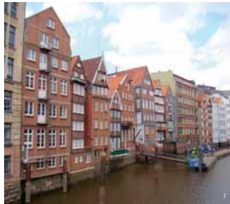
1 Ayuntamiento y Bolsa - patio interior 2 Speicherstadt - Candados junto a un canal 3 Canal - Deichstrasse 4 Vista aérea. Ayuntamiento e Iglesia de San Nicolás